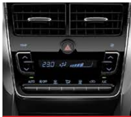
Climatizador Automático Digital. 2