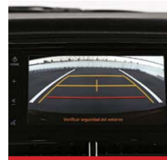
Cámara de Estacionamiento. 1