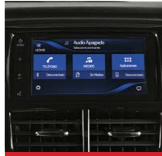
Audio con pantalla táctil LCD de 7". 1