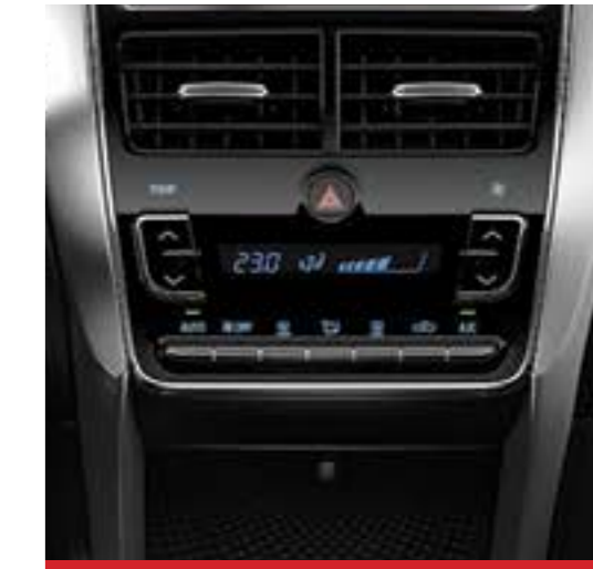
Aire acondicionado con climatizador automático digital. 1