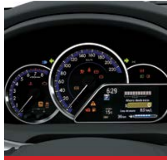
Display de información múltiple de 4,2". 1