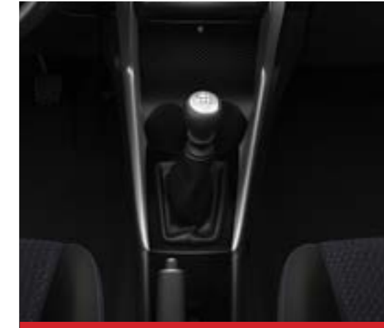
Caja Manual de 6 marchas.