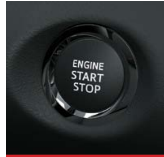
Sistema de apertura y cierre de puertas "Smart Entry System" y encendido por botón "Push Start Button". 3