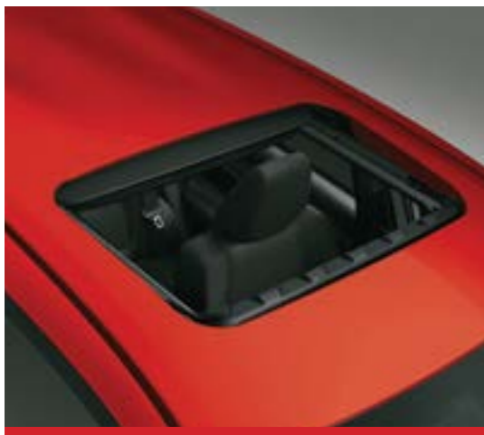
Techo solar eléctrico. 1