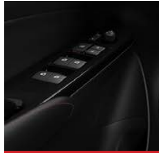
Levanta cristales eléctricos con función "one touch" en las cuatro puertas. 1

Imágenes correspondientes a la versión S CVT. 1 . Disponible en versiones XLS, XLS Pack y S. 2 . Disponible en versiones XLS Pack y S CVT. 3 . Disponible en versiones S.