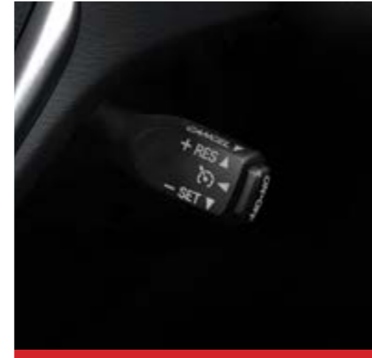
Control de velocidad Crucero. 2