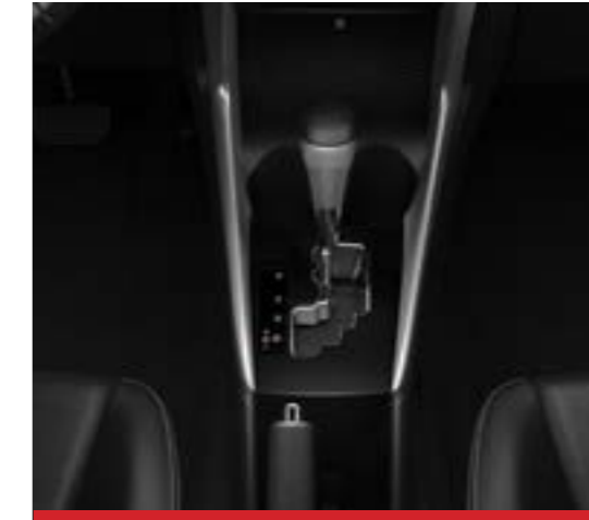
Caja automática CVT de 7 velocidades con control de velocidad crucero. 1

Imágenes correspondientes a las versiones XS y XLS Pack Sedán. 1 . Disponible en versiones XLS Pack y S CVT