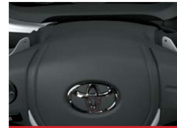
Paddle Shifts (levas en el volante). 1